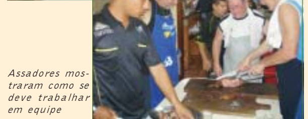
Assadores mostraram como se deve trabalhar em equipe