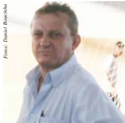
"Passarinho", o administrador do complexo

* Desde agosto, as competições promovidas pelo centro esportivo contam com a arbitragem dos associados ao Sindicato.