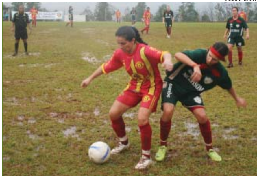
Jogo da segunda rodada do Campeonato Gaúcho de Futebol Feminino, dia 1º de agosto, em Viamão, entre o time da casa Rey Sol e o Juventus de Santa Rosa