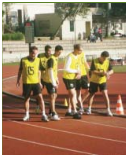
Assistentes em forma