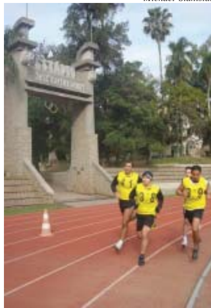
Árbitros mostraram condicionamento

No fechamento desta edição, a Comissão de Arbitragem havia confirmado o reteste físico da arbitragem para o dia 20 de agosto, das 7h às 11h, na pista atlética da SOGIPA. A convocação vale para todos aqueles árbitros e assistentes, da Capital e do Interior, que não passaram ou não participaram da primeira bateria dos testes físicos.