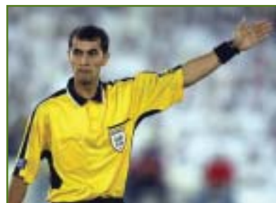
Ravshan Irmatov: a revelação

Para muitos, contudo, pode ter sido o primeiro mundial realizado sob os olhos atentos e implacáveis do Big Brother tecnológico. Por conta disso, o evento colocou em debate o uso de novas ferramentas para auxiliar a arbitragem de futebol. Em 2014, no Brasil, tudo será diferente. Ou não.