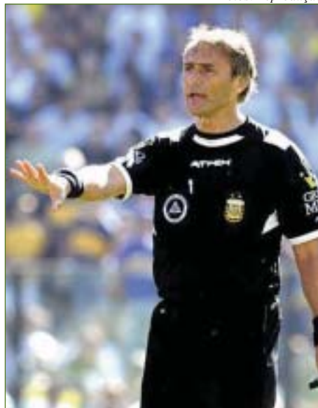
Baldassi: em primeiro lugar

É muito provável que na história do futebol, a Copa do Mundo de 2010 será lembrada principalmente por cinco fatos igualmente inusitados e relevantes, a saber: primeiro Mundial realizado