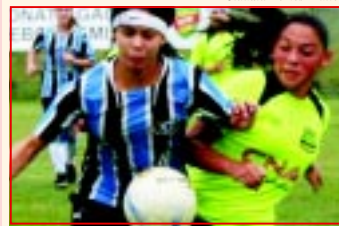
O Grêmio levou a taça de campeã da primeira edição categoria sub-17, realizada no ano passado.