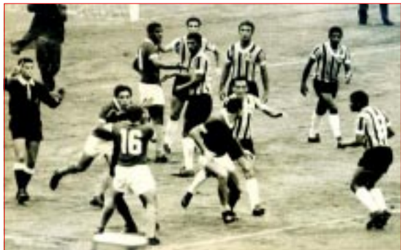
Chapa quente no GreNal da Pancadaria