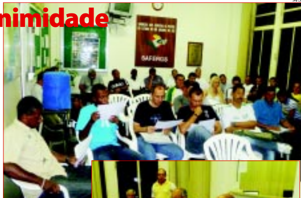
Associados atenderam o chamado da diretoria e compareceram à atividade da entidade de classe da arbitragem gaúcha