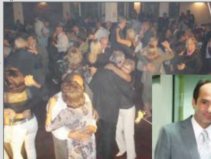
Bons no apito e na dança romântica