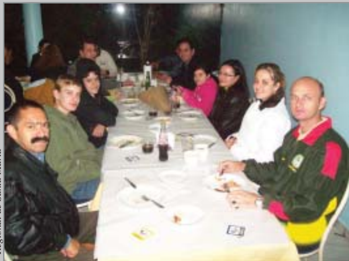
Regional de Santa Maria