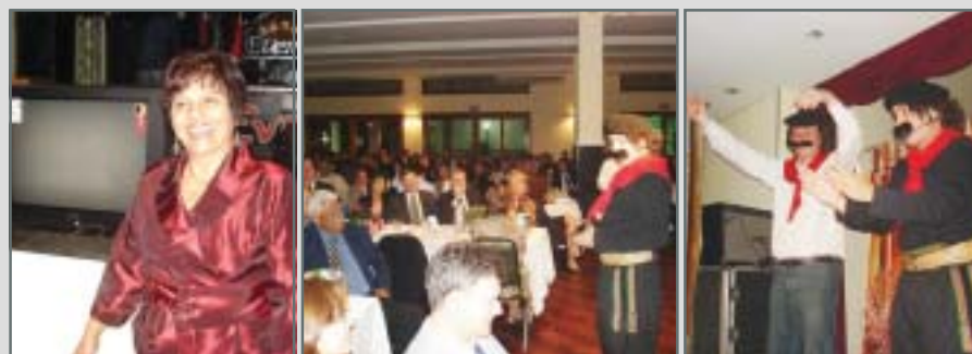
A feliz ganhadora O humor do Guri de Uruguaiana "Baideção" especial