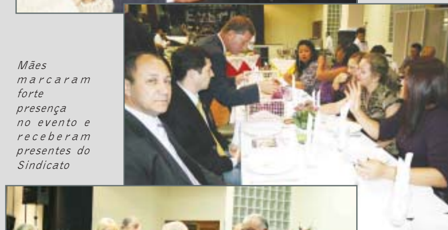
Mães marcaram forte presença no evento e receberam presentes do Sindicato