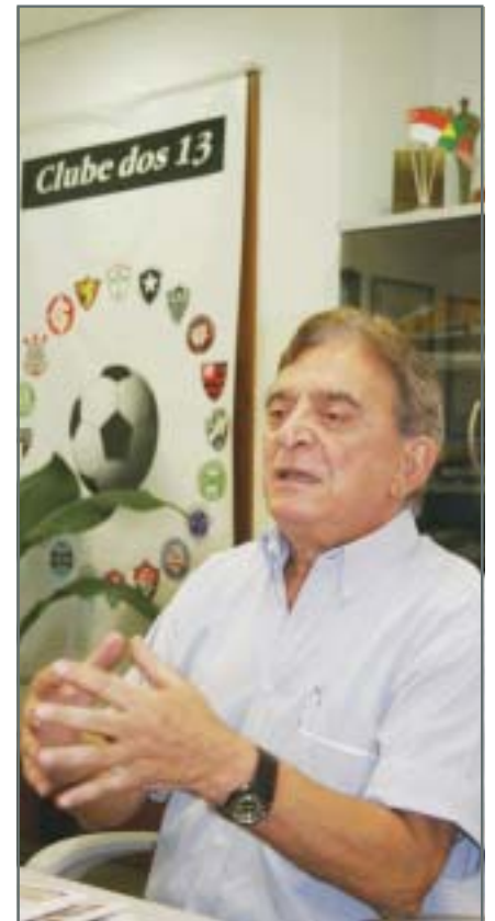
Comandante do Clube dos 13

Está demonstrado, portanto, que as autoridades mundiais da arbitragem buscam diminuir a incidência de erros. Mas, enquanto as inovações não são aprovadas e aplicadas, seria conveniente que todos os desportistas, sem exceção, se empenhassem em tolerar um pouco mais os naturais equívocos que são cometidos. Mesmo sabendo que todos os esforços possíveis serão insuficientes para erradicar, totalmente, os deslizos do apito.