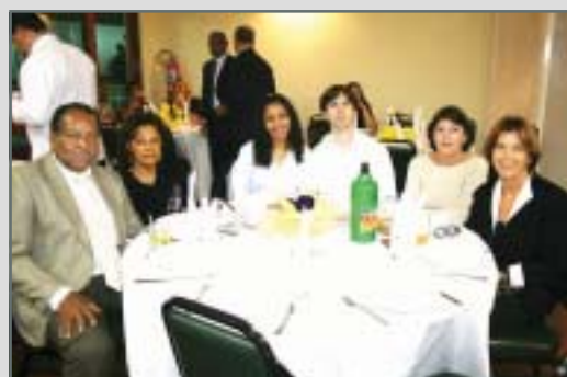
Delcimo e família