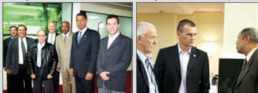
Organizadores a postos Papo cabeça com a "chefia"