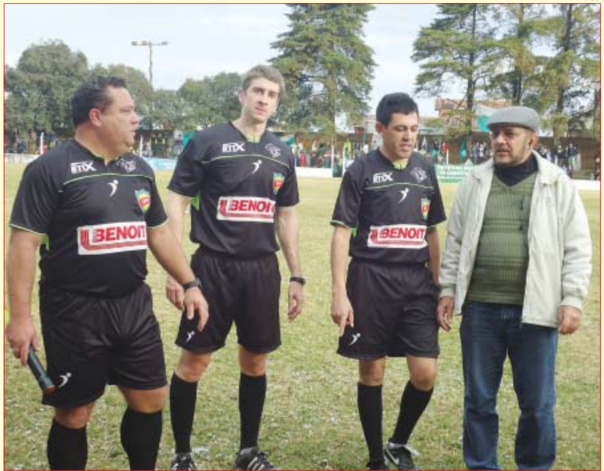
O trabalho da arbitragem foi considerado nota 10, pelos organizadores da competição, técnicos, atletas e a imprensa esportiva que cobriu a decisão