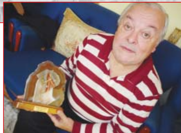
Acima, foto de uma gincana de arbitragem promovida pela Federação nos chamados anos de chumbo. No detalhe, o Troféu Carlos Simon