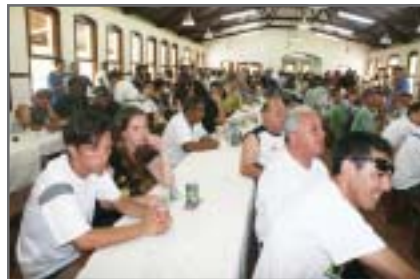
Interior marcou forte presença