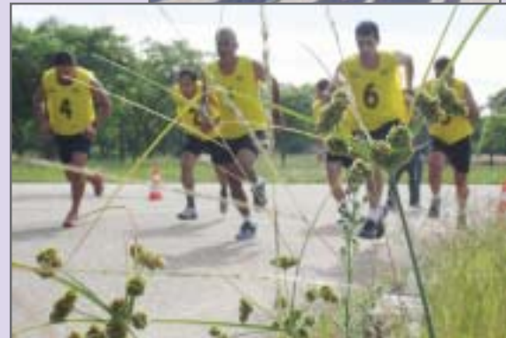
Sob calor intenso, associados do SAFERGS superaram as marcas dos testes físicos da Federação Gaúcha de Futebol

tas e a bica jorrando água sem parar, entre sorrisos e cumprimentos, os participantes lembravam de testes anteriores ou dos novos que teriam que fazer. Percebe-se a alegria, a descontração, apesar da vida que levam, de muitas exigências e privações.