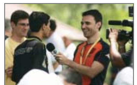
Imprensa repercutiu o evento