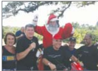
Papai Noel: animação e presentes

A diretoria informa que, por conta da aprovação de todos, o local da tradicional festa de fim de ano do SAFERGS será mantido na "Sede do Colégio Farroupilha", na RS 40. Confira as imagens da festa de 2008.