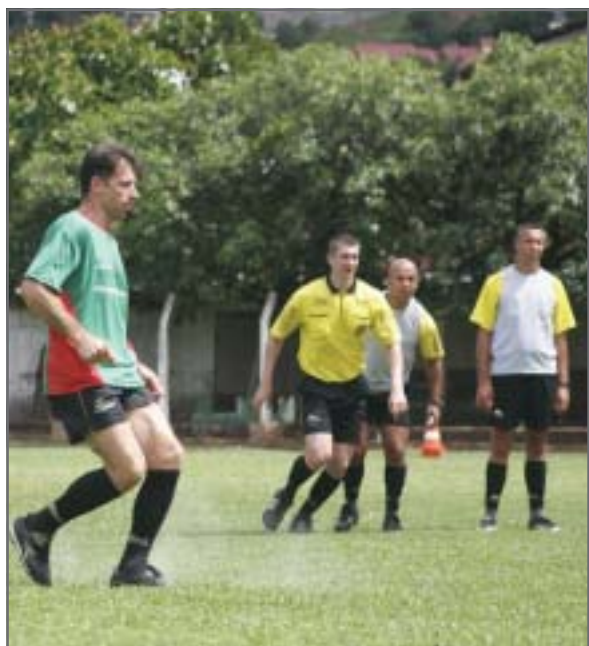
Altemir Hausmann na pré-temporada dos árbitros

O presidente do SAFERGS e árbitro FIFA Carlos Simon, continua firme na sua trajetória rumo a sua terceira Copa do Mundo. No próximo dia 28 de março, ele apita o jogo entre Uruguai X Paraguai, válido pelas Eliminatórias da Copa do Mundo de 2010.