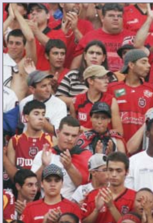
Torcida do Xavante

Outra mudança atingiu a regra 11, do impedimento. A partir de agora "um defensor que deixe o campo por qualquer motivo sem autorização do árbitro será considerado como se estivesse sobre a linha do seu gol até a próxima parada", dando assim condição de jogo a um atacante que poderia ficar impedido.