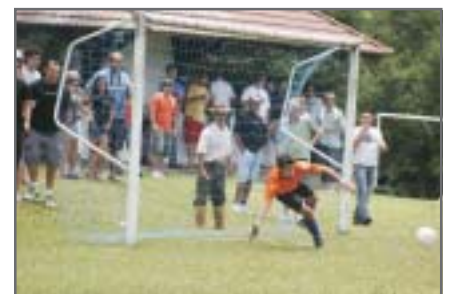
Craques do apito também jogam bola