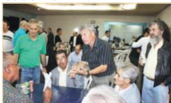
Em cada mesa uma história a ser contada