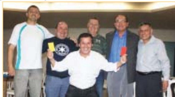
Equipe preparada para o "confronto"