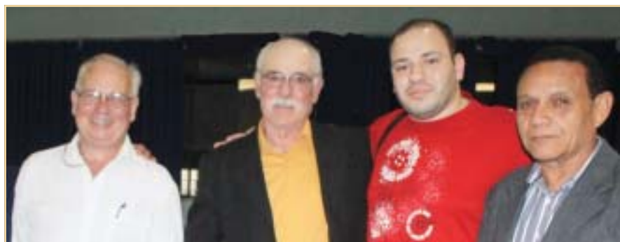
Quatro homens que atuaram dentro das quatro linhas