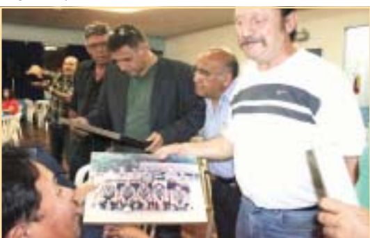
Recordações de um tempo que não volta mais