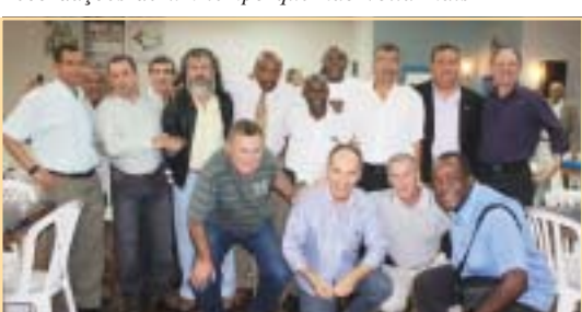
Turma sempre reunida permanece unida