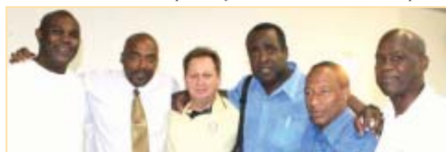
Seis homens realmente da pesada