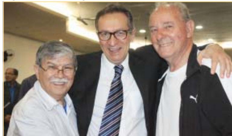
Um trio de muito prestígio