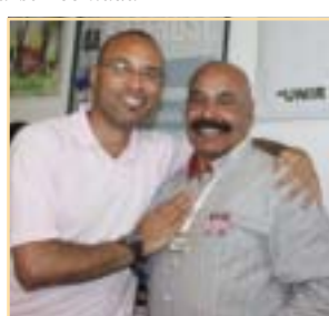
Tal pai, tal filho