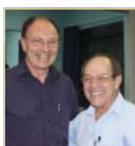
Altos e baixos