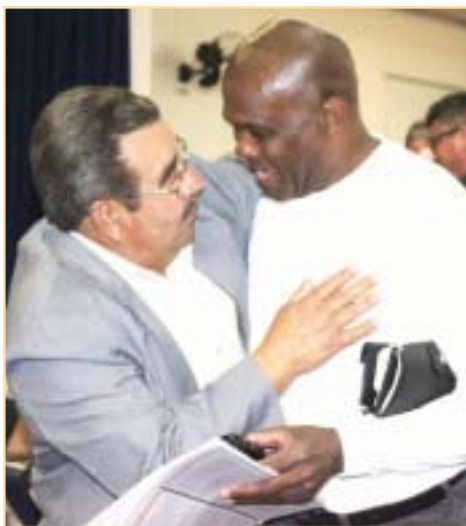
Matando a saudade