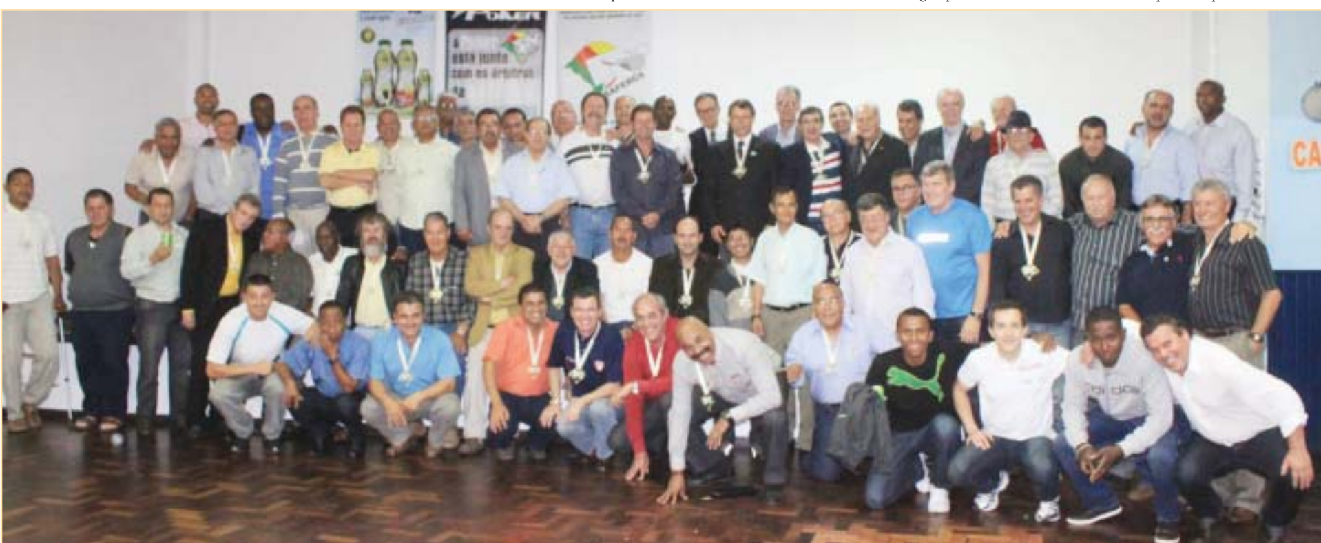
Fotografia oficial do Segundo Encontro da Velha Guarda do Apito