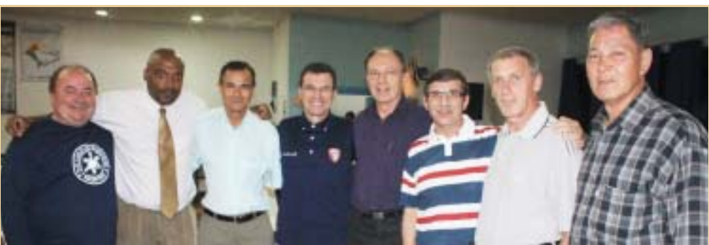
Árbitros e assistentes, alguns ainda na ativa e outros que já penduraram o apito e as bandeiras