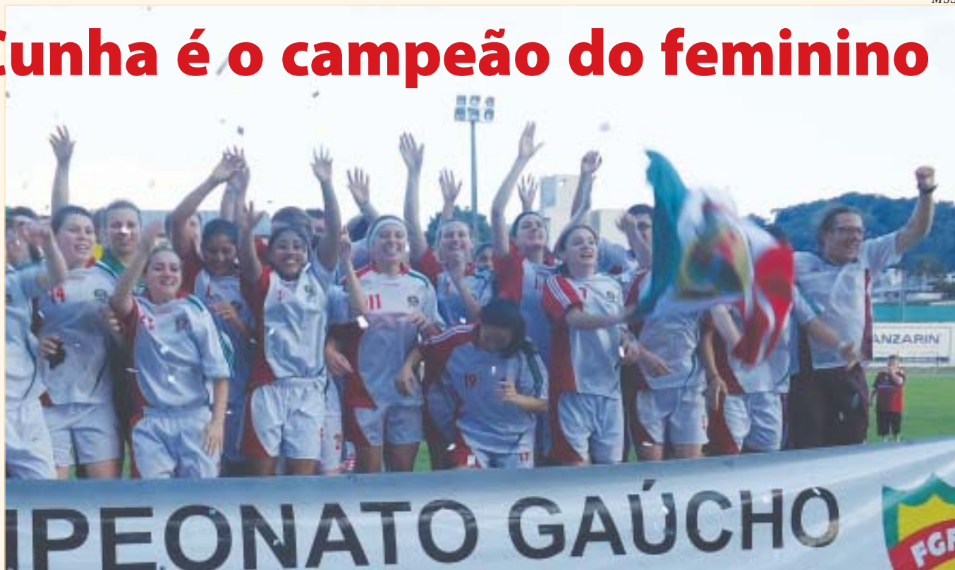
Vitória das meninas de Flores da Cunha mostra força do Interior