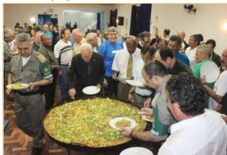
Pausa para apreciar as delícias da culinária espanhola com acento gaudério