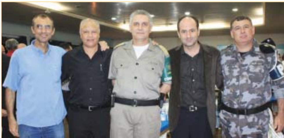
Comando da Brigada e dirigentes sindicais, do passado e do presente