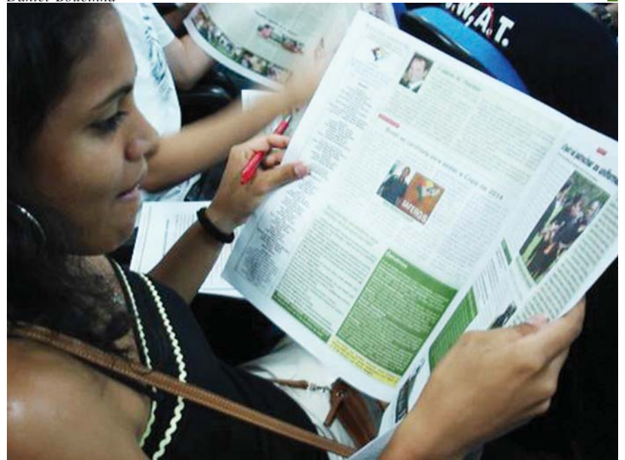
Jornal Marca da Cal, uma das realizações da gestão