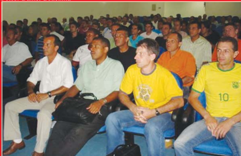
Palestras para capacitação profissional...