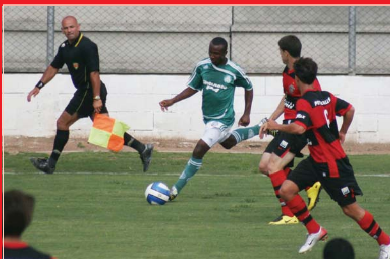
...tiveram como resultado competência dentro das quatro linhas