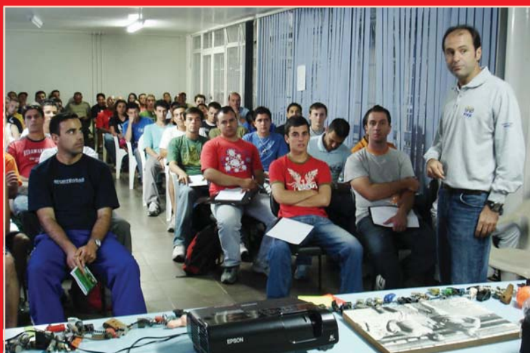
SAFERGS investe na formação de novos profissionais do apito