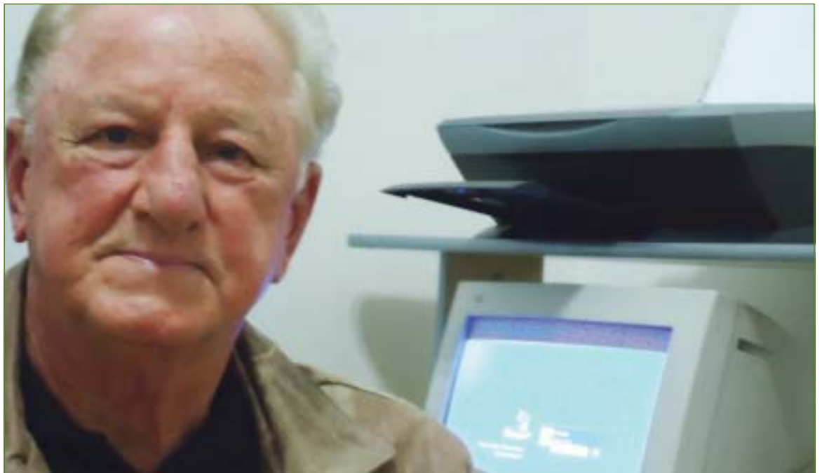
Seriedade e competência

Como costumava acontecer entre os homens do apito e das bandeiras do Rio Grande, Fuchs também enfrentou paradas indigestas com a insatisfação dos torcedores do interior. Ele relembra uma destas situações: "jogavam em Bagé, Guaraní e Internacional. Eu era um dos